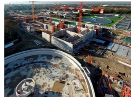
Vue chantier - Zone HYBAS™ et clarificateurs