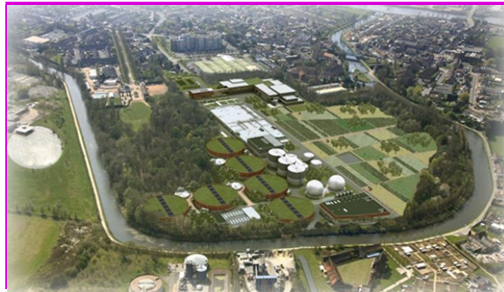
Vue aérienne du site dans sa configuration future