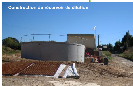
Construction du réservoir de dilution

Pour raccorder trois nouvelles communes, le fonctionnement global du syndicat a été réétudié à l'aide d'une modélisation, notamment pour déterminer les ratios de dilution des eaux de ses trois captages principaux. Un réservoir de dilution de 400 m 3 a été dimensionné.