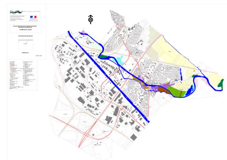
Exemple d'une carte d'enjeux du PPRI Ouche