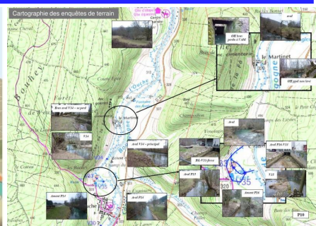
Cartographie des enquêtes de terrain